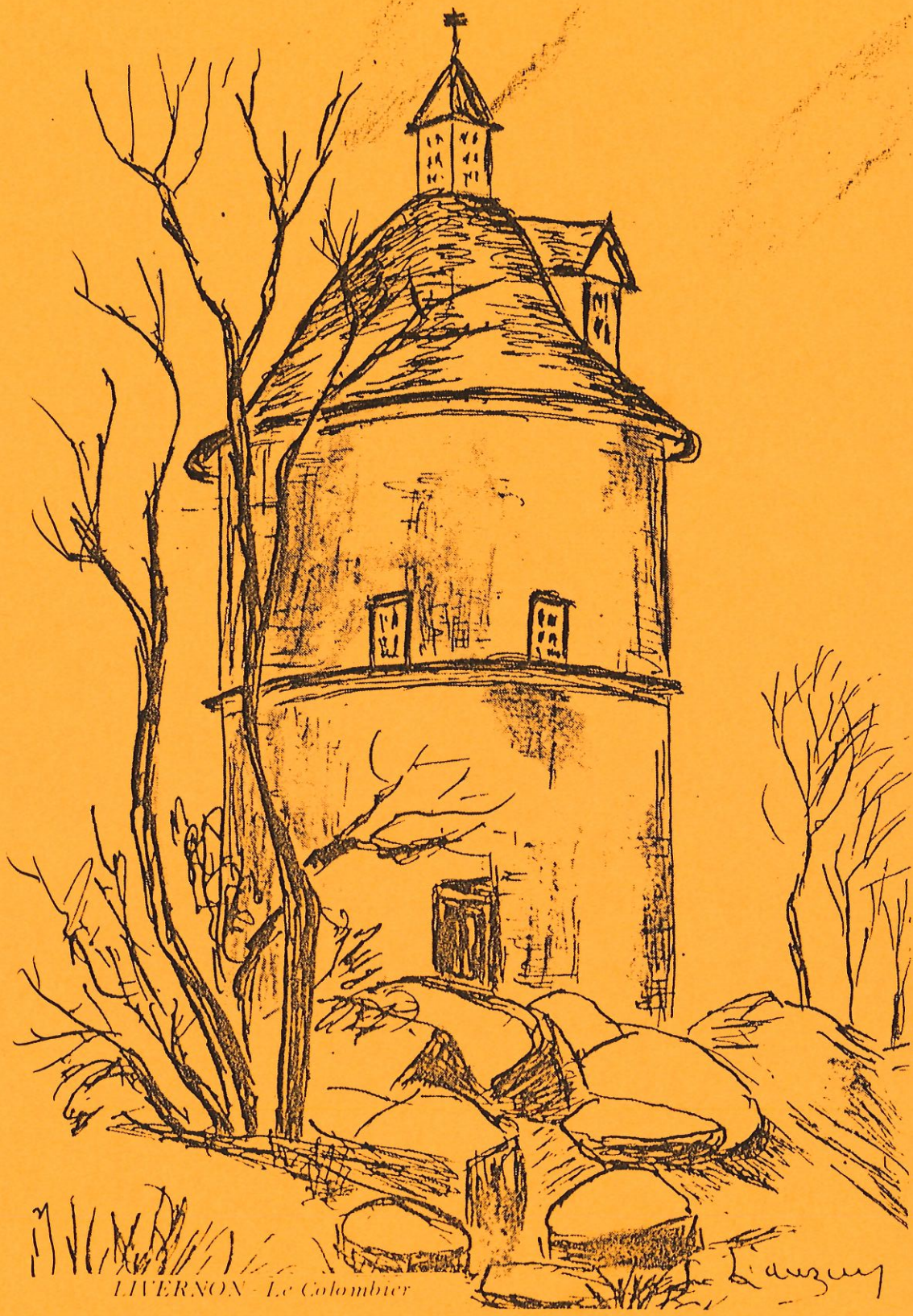
LIVERNON - Le Colombier